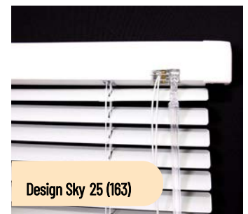
Design Sky 25 (163)