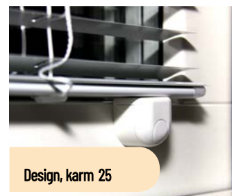
Design, karm 25