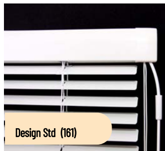
Design Std (161)