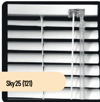
Sky 25 (121)

Vid kopplade bågar är det här ett bra alternativ då persiennen sitter mellan glasen.