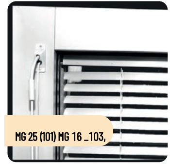
MG 25 (101) MG 16 _103,

Monteras på fasta fönster. När nischdjupet är mer än 20 mm kapas överlisten 10 mm så att vridstången får plats.