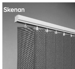
Skenan Profilen har en mjukt rundad front.