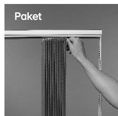
Paket Frigör lamellpaketet vid ex fönsterputsning.