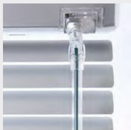
Skyline– vinkla och lås persiennen i ett