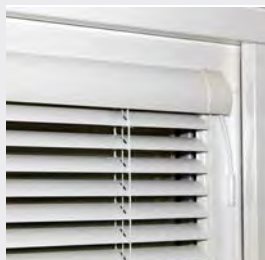
Designlisten integrerar persiennen med fönstret