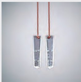
Delbar linkknopp – en viktig säkerhetsdetalj för barn och husdjur